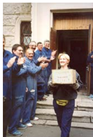
La dernière boîte d'archives belges quitte les anciennes archives spéciales (désormais partie des archives militaires d'Etat de Russie) pour être chargée dans un camion militaire belge en vue du convoi à travers l'Europe (mai 2002).

N° de délivrance de la carte (si présent) _____