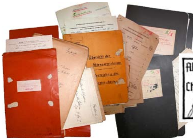
Inventaires allemands des dossiers militaires Ouest européens détenus dans les Heeresarchiv, le dépôt d'archives top secrètes de Berlin-Wannsee. Beaucoup de ces dossiers ont récemment été restitués, mais ces inventaires demeurent à Moscou.